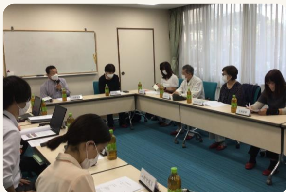
▲ 幹事会のご様子です。

上記のモバイルディスプレイと一緒に使用する物品になります。モバイルディスプレイに差し込むことで無料で視聴できる映像コンテンツとしてYouTubeやABEMA等をお楽しみいただけます。