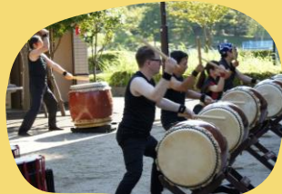
身体と心に響き渡る演奏でした！