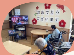
モート中継も活用しました！