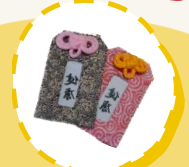
素敵なお守りです！