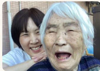
長寿を祝う集いの日に撮影したお母様との2ショット写真です。

私の母が2015年9月より和楽苑でお世話になっております。当初、兄の住んでいる神奈川県の有料老人ホームに入居していましたが、私が住んでいる家の近くの和楽苑に入所する事が出来ました。私は2013年に江戸川区に引っ越してきたので知らなかったのですが、周りからは口を揃えて「和楽苑はとても良い所だ」と言われ羨ましがられました。イベントやボランティア活動が沢山あったり、職員の方々は手厚い看護とお世話をしてくださったりと、周りが言うように、本当に楽しく良いところに入居する事が出来たと実感しております。その感謝の気持ちと、入居者の方々が快適に生活できる様に、入居者のご家族の代表として家族会副会長を務めさせていただきますのでよろしくお願いいたします。