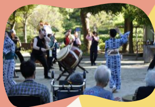
素敵なお守りです！